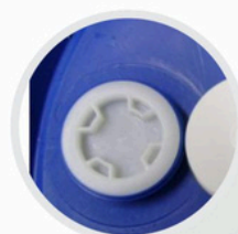
Tampa com Rosca